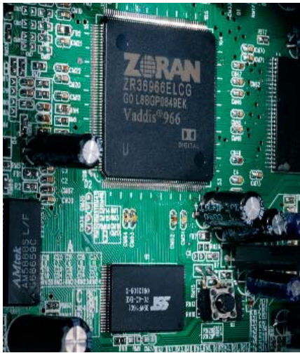
Der Zoran Audio/Video-Prozessor liefert ein hervorragend scharfes Bild und ist Full-HD-fähig (1080 P)