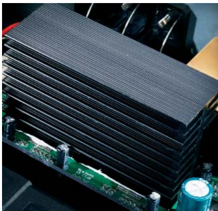
Der VC 2 ist mit hochwertigen Bauteilen bestückt, wie die Endstufe